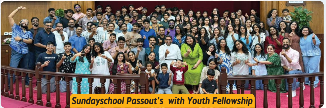
Sundayschool Passout's with Youth Fellowship